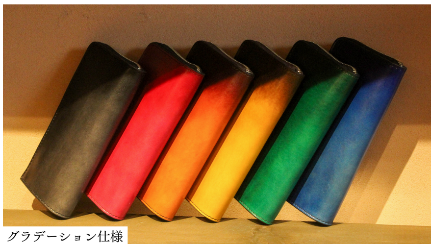
グラデーション仕様